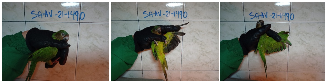
Fotografías 3 a 5. Valoración del individuo SA-AV-21-1490 Eupsittula pertinax (Cotorra carisucia). Acta Única de Control al tráfico ilegal de flora y fauna silvestre No. 161187.